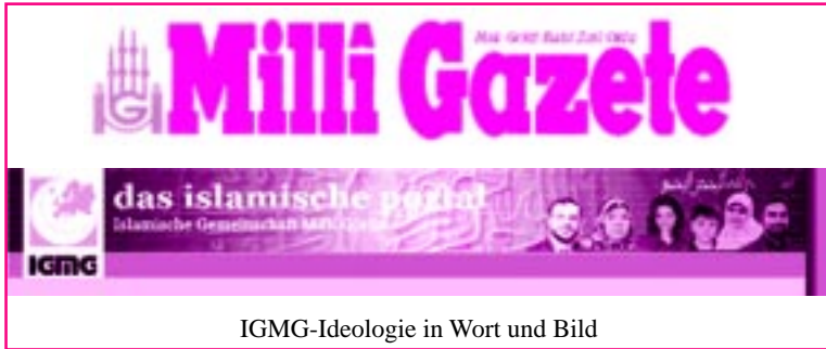
IGMG-Ideologie in Wort und Bild

Die IGMG ist vorrangig im Bereich kultureller und religiöser Bildung unter in Deutschland lebenden türkischen Jugendlichen aktiv. Es gibt begründete Zweifel, ob die IGMG wirklich an einer Integration der von ihnen betreuten Jugendlichen in die deutsche Gesellschaft arbeitet oder ob sie nicht vielmehr zum Aufbau von Parallelgesellschaften beiträgt. Außerdem hat sich die IGMG bei allen Modernisierungsansätzen bislang nicht von der extremistischen Ideologie Erbakans distanziert. Die formal von der IGMG unabhängige Zeitung „Milli Gazete“, die für die