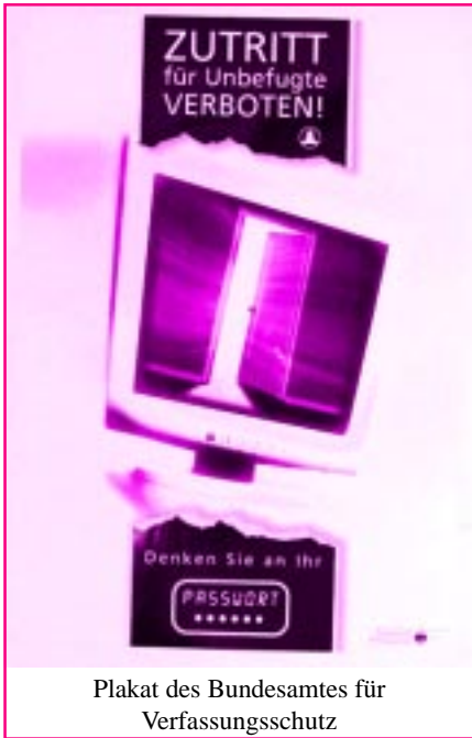
Plakat des Bundesamtes für Verfassungsschutz

Nachrichtendienste nutzen sowohl offene als auch verdeckte Mittel zur Informationsbeschaffung. So können Mitarbeiter fremder Nachrichtendienste als Diplomaten, Geschäftsleute oder Journalisten tätig sein oder