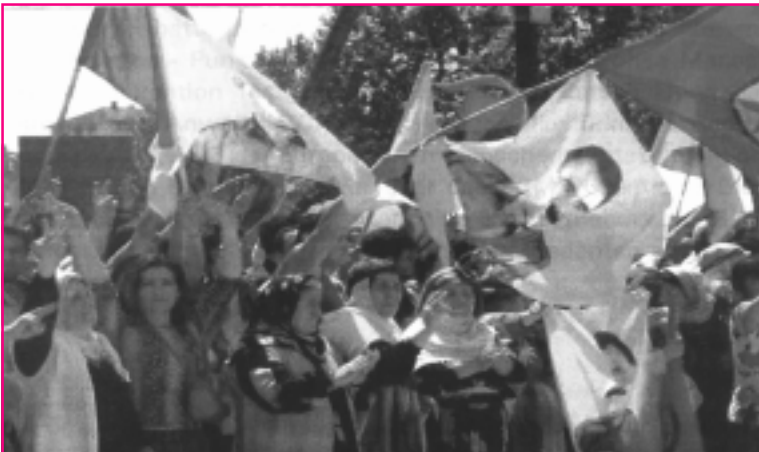
Demonstration des KONGRA GEL am 9. Juni 2004 in Straßburg

Treffen ausländische Extremisten in Deutschland auf Landsleute, die sie als politische Gegner ansehen, kann es zu konflikträchtigen Spannungen kommen, die sich mitunter in Gewalttaten entladen. Mit Gewalt gehen nicht wenige ausländerextremistische Organisationen aber auch gegen eigene Mitglieder vor, wenn sie die Reihen von Abweichlern und Spaltern säubern und Abtrünnige bestrafen wollen. Das demokratische Deckmäntelchen, das sich solche Organisationen umhängen, ist fadenscheinig, denn fast immer sind sie auf eine autoritäre Führerpersönlichkeit ausgerichtet und funktionieren nach dem Prinzip von Befehl und Gehorsam.