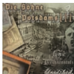
CD-Cover „Die Söhne Potsdams III“ von Potsdamers Bands