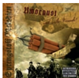
CD-Cover „Sprengstoff Melodien“ der Band Uwocaust